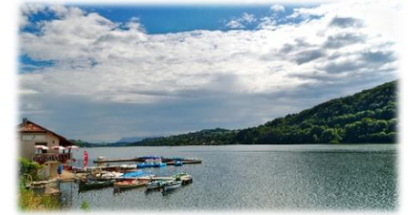
Lac de Paladru