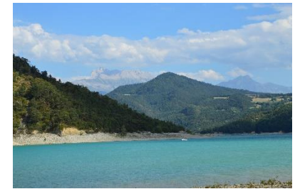
Lac du Monteynard